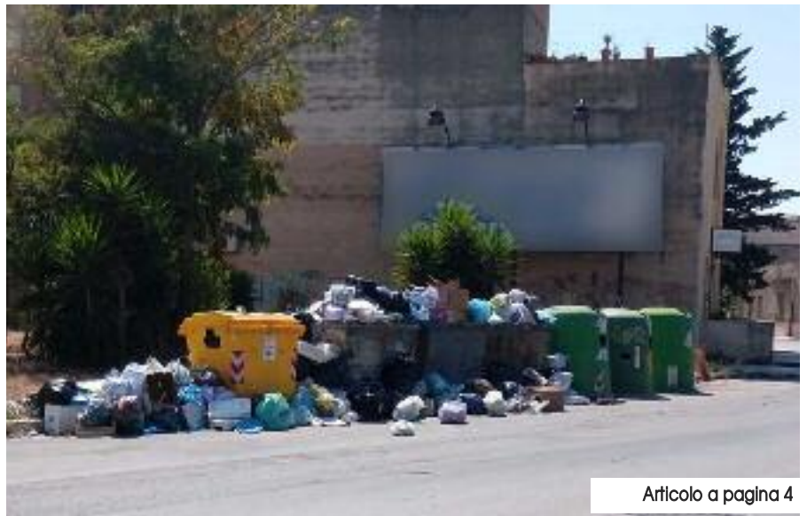
Articolo a pagina 4